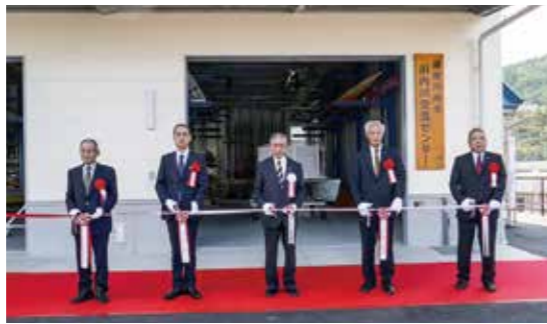
▲落成式におけるテープカットのようす

薩摩川内市 川内川交流センター完成 川内川を通して交流する人々がふれあう拠点施設として、西開聞町に会議室や艇庫を備えた「薩摩川内市川内川交流センター」が完成しました。ぜひご利用ください。