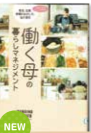
働く母の暮らしマネジメント 編/主婦の友社