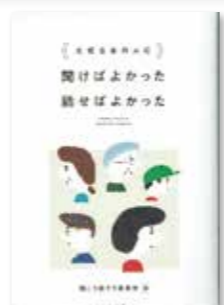
あとを継ぐひと 著/田中 兆子

父母や家族、友人など大切な人への「～すればよかった」の後悔を基に、113人の体験とアドバイスを紹介。また、聞かれたらうれしい質問や伝えておきたいこと、してもらってうれしかったことも紹介されており、人とのつながりを深める1冊です。