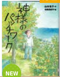
神様のパッチワーク 作/山本 悦子 絵/佐藤真紀子