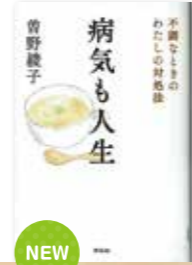
病気も人生 著/曾野 綾子