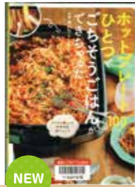
ホットプレートひとつでござろうごはんができた! 100 編/主婦の友社