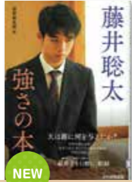
藤井聡太 強さの本質 編/日本将棋連盟