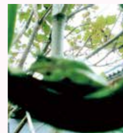
我が家のペコちゃん

朝顔に新種のバツタ？ 小学1年生の娘が学校から持ってきた朝顔に、シヨウリヨウバツタが住み着いています。朝に水やりしていると、いつもと違うバツタが・・・よく見てみるとバツタの抜け殻でした！珍しいと思い写真に撮ってみました。