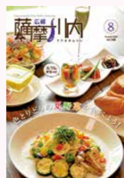
野菜テーマ対談に新しい学び

我が家のペコちゃん 曲がったキュウリの上で、お休みのアオガエルさんです。写真がボケてしまいました。写真がボケてしまいましたが、そのお一つと触って「あなたも新型コロナウィルス感染予防に気を付けようね」と語り掛けました。また再会する喜びを感じさせる時間を過ごしました。ありがとうございます。(犬猫大好き) 81歳