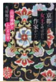
京都に女王と呼ばれた作家がいた～山村美紗とふたりの男～ 著／花房 観音