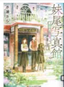
妹尾写真館 ～帰らぬ人との最後の一枚、お撮りします～