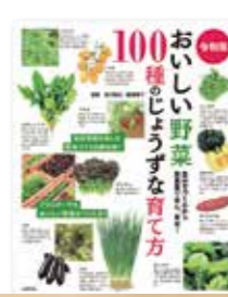
令和版 美味しい野菜 100 種のじょうずな育て方 編／主婦の友社