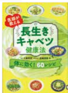
医師が教える長生きキャベツ健康法