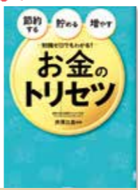
節約する・貯める・増やす 知識ゼロでもわかる! お金のトリセツ 監／井澤 江美