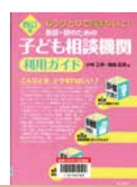
教師・親のための 子ども相談機関利用ガイド 編／小林 正幸・嶋崎 政男