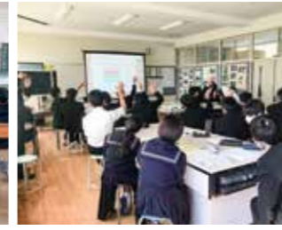
▲海星・海陽中学校合同