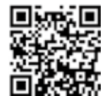
てらやまんち(少年自然の家)HP

こんないろいろなできごと、こんなに広大な敷地や施設。利用の仕方はあなた次第。 新型コロナウイルス感染防止対策もしながら万全の体制で、皆さんが来てくれるのを待っているそうです。 見学は自由にできるみたいなので、気軽に連絡してほしいとのこと。 体験、発見、冒険！ あなたの発想力を生かして、みんなでワクワクすること始めてみてね。