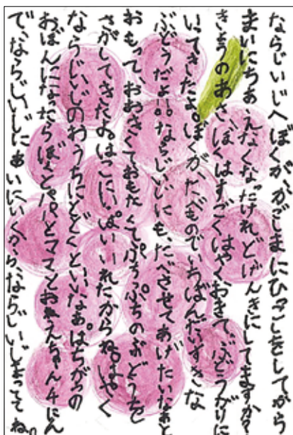
▲小学1年生で文部科学大臣賞に輝いた昨年度のはがき作文