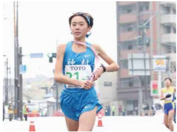
▲全国優勝を目標に、日々鍛錬を続けている(写真は選抜女子駅伝北九州大会2020)