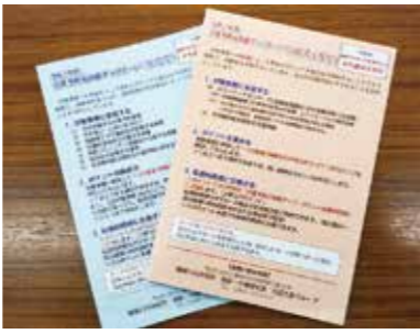
令和2年度カード(見本)

介護予防元気度アップ事業ポイント転換は、次の日程で臨時受付窓口を開設します。 受付方法/令和2年度介護予防元気度アップカードをお持ちください。 ※カードに氏名・住所・連絡先の記載と押印がされているかどうかを事前にご確認ください。 ※4月12日(月)以降は本庁2階高齢・介護福祉課または各支所でも受け付けを開始します。 問 本庁高齢・介護福祉課包括支援G ☎(2675)