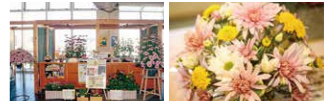
*ロスフラワーとは：規格外で市場出荷のできない花のこと

2月12日(金)～22日(月)、川内駅改札前で、ロスフラワーを活用した花の展示が行われました。これは、新型コロナウイルスの影響で冠婚葬祭やイベントなどの自粛が相次ぎ、花の消費が減ったため、家庭での花消費拡大のために企画されたものです。市内3軒の花農家で生産された花々が色鮮やかに構内を彩りました。