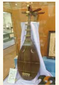
丸山友次郎作薩摩琵琶 (入来郷土館所蔵)