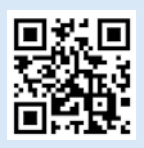
▲コロナワクチンナビ

開設日時/9月30日(木)まで(延長する場合あり)の月曜日~土曜日8時30分~17時30分 ※日曜・祝日は休み 市コールセンター ☎050(3850)0018 ☎099(833)3221 ☎099(225)0672 ☎099(225)0672 ▲コロナワクチンナビ