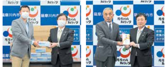
▲九州樹脂工業株式会社・株式会社 中天貿易 ▲薩摩川内市管工事業協同組合

新型コロナウイルス感染症対策のために、市に対して、九州樹脂工業(株)・(株)中天貿易からマスク 10万枚の寄贈と薩摩川内市管工事業協同組合から寄附を頂きました。 ※敬称略