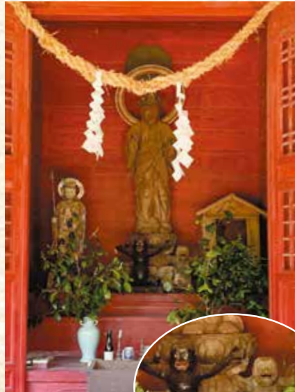
▲戸田観音(中村町)がらっぱ像2体が祭られている

がらっぱ 南九州に伝わる妖怪。河童に似た名前のおり、単にカッパの訛りとも言われるが、カッパに似た別の妖怪という説もある。本市に流れる川内川に生息しているというのは全国的に有名。頭に皿があり、手足が長い。春と秋に山と川を行き来し、「ヒー、ヒョー」と鳴く。 好きな物はキュウリ、尻子玉(で、嫌いな物は、金物や仏飯。