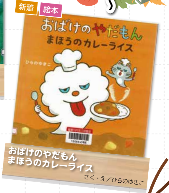
おばけのやだもん まほうのカレーライス 著/ひらのゆきこ