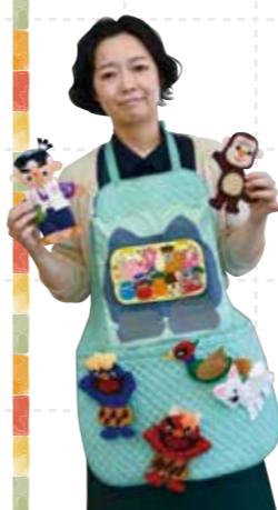
エプロンシアター