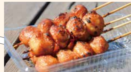
14 しんこだんごの鬼塚のしんこだんご 所在地/宮崎町 3691-4 ☎ (20) 0057 イベントにも出店されるしんこだんごの鬼塚の「しんこだんご」は、一つ一つのおいしさにしっかりとした食べ応えが◎。