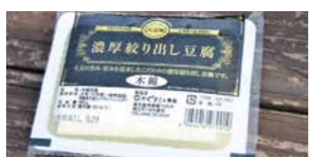
18 くすもと食品と大豆の華の豆腐 所在地/楠元町 1906 ☎ (29) 2434 田海町 451-1 ☎ (30) 1891 地元の人たちからも「昔から柔らかくておいしい」と愛されるくすもと食品の「豆腐」。楠元町にある工場は、基本的に生産のみなので、豆腐などの購入は移動販売車や大豆の華でどうぞ。