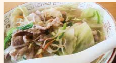
15 隈之城食堂のちゃんぽん 所在地/隈之城町 1469-1 ☎ (22) 2055 豊富な麺類に定食も。さまざまなメニューをそろえる隈之城食堂の「ちゃんぽん」は、麺だけでなく、肉も野菜もしっかりウマイ極上の一杯。