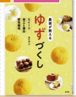
農家が教えるゆずづくし 編/農山漁村文化協会