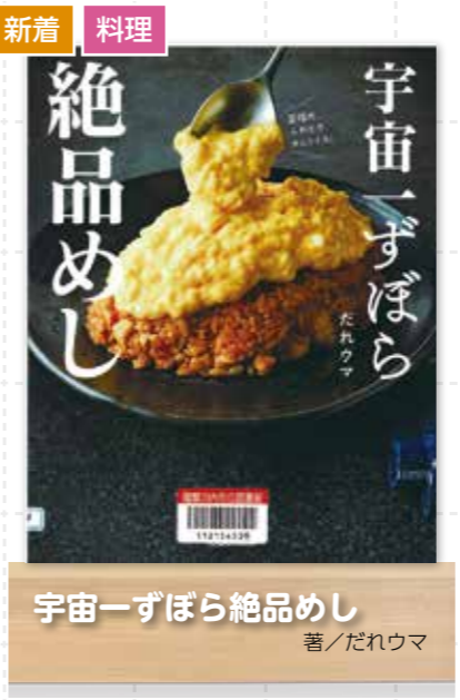
宇宙一ずぼら 絶品めし 著/だれウマ

読書の秋は、唐代の詩人として高名な韓愈が詠んだ漢詩「時秋積雨霽、新涼入郊墟。燈火稍可親、簡編可卷舒。」秋になり長雨が上って空も晴れ、涼しさが丘陵にも及んでいる。ようやく夜の灯に親しみ、書物を広げられるのが由来になったといわれています。涼しく、本をゆっくり読むのも最適な季節です。 コロナ禍のステイホームでも一人で楽しめる読書。 普段本を読まない人は、ぜひこの機会に、本を手にとってみませんか。また、本を普段から読む人はこの機会に、ジャンルを広げて本を読んでみませんか。 今回は、3ページにわたり、この季節に おすすめの本を紹介します。