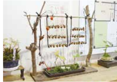
▲入来温泉湯之山館

市民の方から、入来支所などにかわいらしい柿の置物を頂きました。これは、盆栽用の柿(ロウヤガキ)が、自宅の庭で約200個の実をつけたため、干し柿にし、秋を感じたいと趣味で作られたものです。入来支所、入来温泉湯之山館に展示され、訪れた人々に小さい秋の癒やしを届けていただきました。