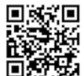
▲文部科学省HP (行動嗜癖について)

「まちの話題」は、市民の皆さんから情報提供をいただき、身近な話題を掲載しています。ぜひ投稿ください。