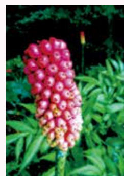
見つけたぞヤマコンニャク

で見ました。びっくりしましたね。地球のどこかががらっぱは生きているのだと実感しました。キュウリを好きだというのは分かりませんが…。 M.Sさん