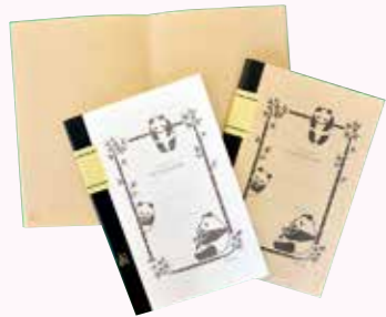
▲竹紙100ノート (中越パルプ工業(株)川内工場提供)

※うぶごえとおくやみは、本庁市民課または各支所、甌島振興局などに届け出(出生・死亡)をされた方で、広報紙への掲載に同意された方のみを掲載しています。