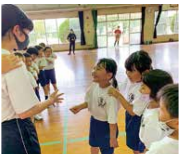
祁答院中学校区【前期・後期交流】

対象／小学5年生、中学1・2年生 教科／小学校4教科、中学校5教科 時期／毎年1月 分析／特に小学校の社会と中学校の数学において、基礎・基本を確実に定着させる必要があります。 標準学力検査(NRT) 対象／小学2年生、中学3年生 時期／毎年4月 分析／アンダーアチバー(本来持っている能力に対して、学力の定着が十分でない児童生徒)が2割弱います。