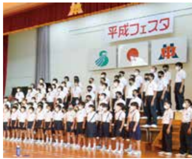
平成中学校区【平成フェスタ】

小中一貫教育の新たなねらいの背景には、本市の市民憲章があります。「心がかよふ」ことで、課題を共有することができ、学力の確実な定着に向けて、「分かった」「できた」など、子どもも教員も学びを実感することを重視しています。 また、どんな状況下においても、子どもたちが安心感を持てるように、次のような関わりが大切であると考えています。 「視線を合わせて」「声を掛け合い」「笑顔で接すること」で子どもや教員が「心をかよわせ」、共に学ぶ喜びを味わい、9年間の学びが途切れないような取り組みを、全ての中学校区において、一丸となって推進していきます。