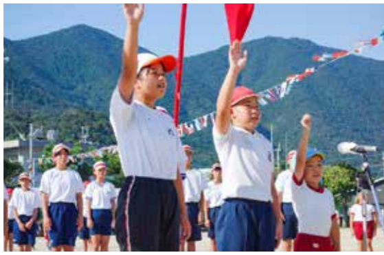
里中学校区【幼・小・中合同運動会】

具体的には、「読み・書き・算」など、学習の基盤となる技能や、各教科への興味・関心、自分から進んで学ぼうとする「学習への構え」など、発達の段階に応じた確実に身に付けることができるよう、計画に基づき、評価や結果を踏まえ、より分かりやすい授業となるよう取り組んでいます。