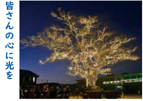
皆さんの心に光を

学校に残る資料にもこのセンダンがなぜ校庭のど真ん中に植えられたのか残されておらず、その理由は明らかにはなっていませんが、やはり、校庭の真ん中にあるということでも今度何度も邪魔だと指摘され、切っけはどうかという話もあつたといえます。 その一方で、子どもたちが木陰で休んだり、サッカーをするときはセンダンを使って限之城小学校ならではの攻防を繰り広げたりと子どもたちに寄り添って共に成長してきた木であるように思われます。 また、運動会ではセンダンを利用して万国旗を飾ったり、元気がない際は樹木医に見てもらうなど、歴代の卒業生も限之城小学校を代表するシンボルツリーとして代々大事に受け継いできたのだといえます。 昔から当たり前に校庭の真ん中にあったセンダン。卒業生からは校長先生の話にもよく話題が出てきたという話も耳にしました。この木の存在は、卒業生の青春の一部として、記憶に刻まれているに違いありません。