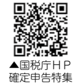
▲国税庁HP 確定申告特集