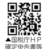
▲国税庁HP 確定申告書等作成コーナー

スマートフォン、タブレットから国税庁ホームページを利用して作成し、e-Taxによる送信または印刷して郵送などにより提出することができます。 川内税務署 ☎(23)2830 ※自動音声案内 ※確定申告に関する相談は、「0」番を選択後「確定申告電話相談センター」につながります。(3月15日(火)まで)