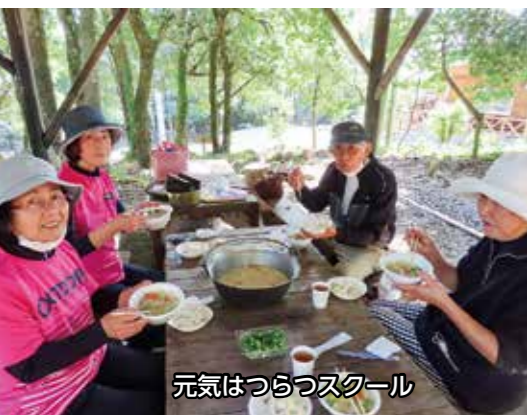
元気はつらつスクール