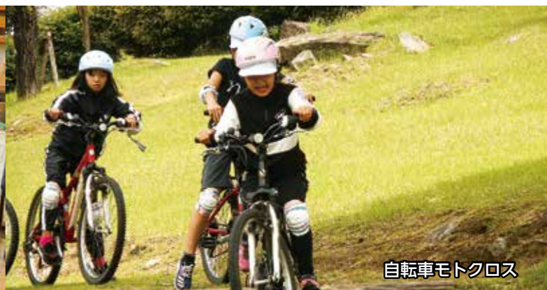
自転車モトクロス