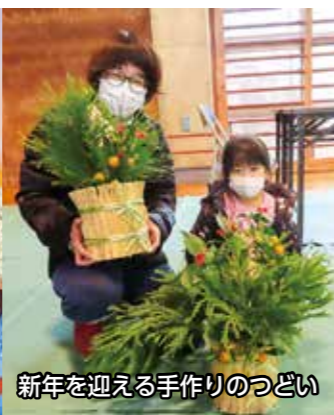
新年を迎える手作りのつどい