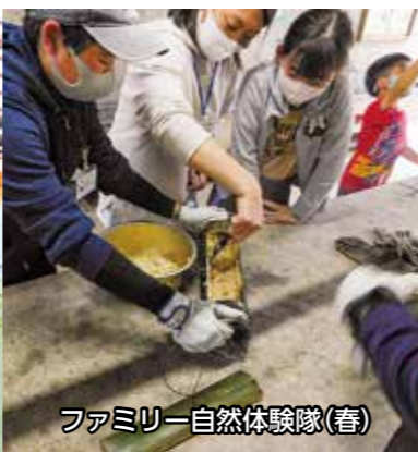
ファミリー自然体験隊(春)