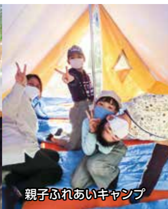
親子ふれあいキャンプ