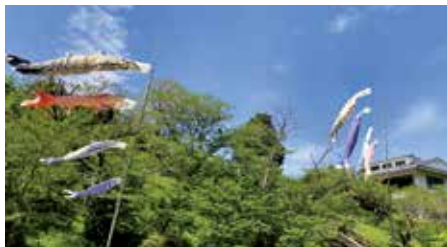
【情報提供：清色地区コミュニティ協議会】