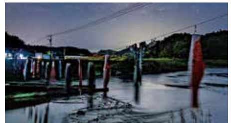
【情報提供：八幡地区コミュニティ協議会】

りました。青空と新緑、お城のような校舎にもよく映えて、気持ちよさそうに泳いでいました。