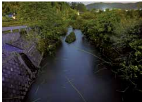
【情報提供：隈之城地区コミュニティ協議会】

隈之城地区コミュニティ協議会環境部では、青山町内のホタルの生息地の保全のために、亀山地区コミュニティ協議会にも協力をもらい、河川土手の草払いをしています。この取り組みにより、5月中旬には町内を流れる河川で美しく舞うホタルが見られました。