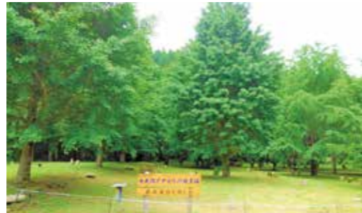
【情報提供：陽成地区コミュニティ協議会】

5月上旬、上大迫自治会総出でイチョウの杜広場を整備しました。広場には椅子を備えてあり、夏はきれいな緑の葉を、秋には美しく色づくイチョウを眺めながらゆっくりと過ごすことができます。ぜひリフレッシュにお越しください。