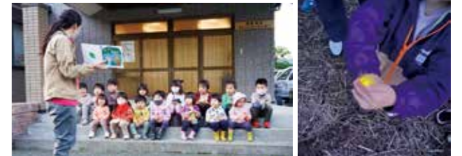
【情報提供：純心幼稚園子育て支援センターぱぴいら】

5月21日(土)、倉野地区で純心幼稚園子育て支援センターぱぴいらのホタルの鑑賞会を開催しました。子どもたちが危なくないよう、地域の方々が川沿いの草払いや柵作りをしてくださいました。幻想的なホタルの光に子どもたちも大喜びで、小さな手の中に包まれた優しい光にかわいらしい瞳も輝きを増していました。