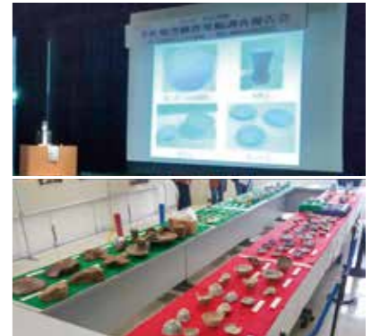
【情報提供：平佐西地区コミュニティ協議会】

5月15日(日)、国際交流センターで平佐焼窯跡群発掘調査報告会が開催されました。昨年10月から開始された、県内最大規模の磁器窯跡群である「平佐焼窯跡群」の調査の解説(速報)と、出土した遺物や写真パネルの展示が行われ、平佐焼窯跡の保存・周辺環境の整備の可能性について意見が交わされました。