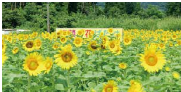
【情報提供：隈之城地区コミュニティ協議会】