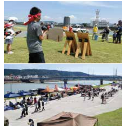
【情報提供：可愛地区コミュニティ協議会】

7月23日(土)、川内川河川敷小路側にて第1回リバーサイドビューエの～サマーフェス～を開催しました。河川敷の魅力を発信するために企画したもので、ウォーターサバゲーやグラウンドゴルフ、屋台村など盛りだくさんの内容で、来場者を楽しませました。