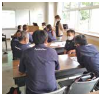
南九州ファミリーマートの方々の養成講座受講の様子

参加された方からは、「認知症についての理解を深められ、接客時の対応の参考になった」「これまでと同様の生活をできるだけ長く送ってもらえるよう支援していきたい」など、非常に有意義な受講になったとの感想が寄せられています。 養成講座は、認知症カフェなどで開催しており、無料で受けられます。 また、ご希望の日時・場所へ講師を派遣することもできます。（ご希望日の約1カ月前までにご連絡ください。）