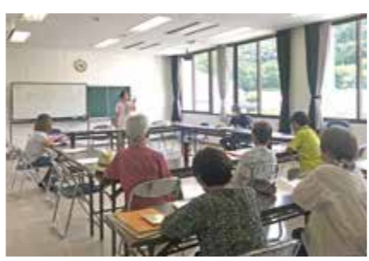
家族介護者の会「よいやんせ」