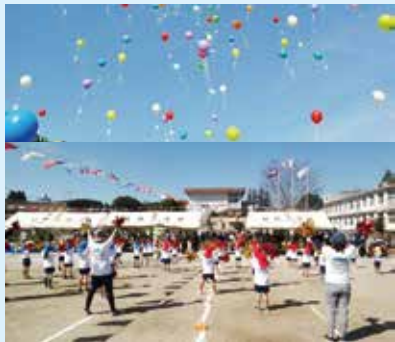
燃ゆる感動かごしま国体薩摩川内市実行委員会(本庁国体推進課内)(☎6431)

「みんなで踊ろう! 国体ダンス ~“おもしろ”をバルーンに乗せて~」 プログラム7番の種目、集団演技では「燃ゆる感動かごしま国体」開催1年前イベントとして、一般および幼稚園児らによる国体ダンス、バルーンリリースを披露します。みんなで国体の開催を盛り上げましょう!