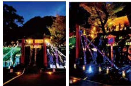
【情報提供：森林と陽成竹振興会】

8月6日(土)、一條神社(陽成町)にて、古尊新創竹まつりを開催しました。陽成地区の竹の歴史と文化を尊びながら新しい視点を取り入れ、プロジェクション・マッピングを交えた映像と竹灯りの融和により、幻想的な空間が創出されました。