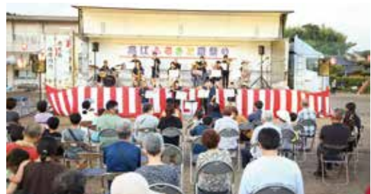
【情報提供：高江一日クラブ】

8月13日(土)、高江未来学校(旧高江中)で高江ふるさと夏祭りを開催しました。天候不良や新型コロナウイルス感染症などの影響により5年ぶりの開催となり、会場は市民楽団のステージ演奏や、数々の出店、打上げ花火など、多くの来場客でにぎわいました。