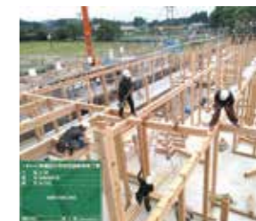
▲組み立て作業の様子

「想い」個性「夢」を生かし、ご要望に沿えるよう、工夫しながら技術を提供するとともに、一つ一つの工事に達成感を感じる事ができるよう、社員一丸となって日々業務に取り組みんでいます。