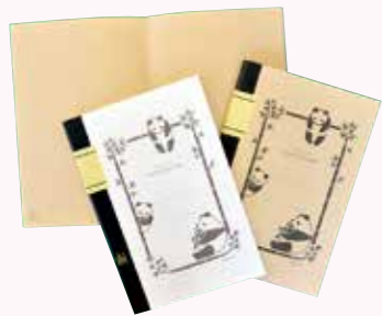
▲竹紙100ノート

※うぶごえとおくやみは、本庁市民課または各支所、甌島振興局などに届け出(出生・死亡)をされた方で、広報紙への掲載に同意された方のみを掲載しています。