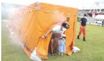
▲火災の煙を体験している様子

9月3日(土)、川内川河川敷大小路側にて(公社)川内青年会議所主催の、さつま川内防災フェスタが開催されました。「備える・学ぶ・活かす・触れる」の4つのテーマで、消火訓練体験や大雨体験、ステージショー、ハザードマップや防災アプリの解説など充実した内容で、多くの方の防災意識向上につなげることができました。