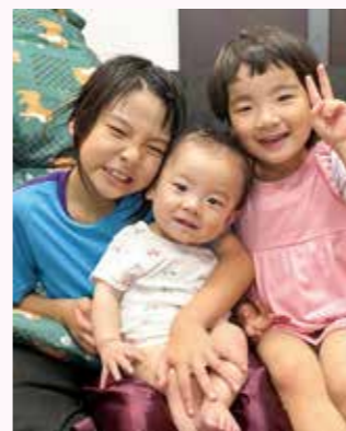
我が家のにぎやかかわいい姉弟。(ペンネーム: かーたん)

提出・問合せ先/本庁コミュニティ課生涯学習・ひとみらい政策G(内線4741) ✉hitomirai@city.satsumasendai.lg.jp