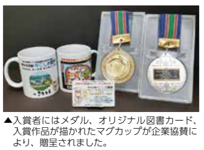
▲入賞者にはメダル、オリジナル図書カード、入賞作品が描かれたマグカップが企業協賛により、贈呈されました。

実行委員会ホームページ およびインスタグラムでは、この他にもさまざまな活動の様子を紹介していきます。ぜひご覧ください。