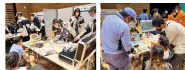
【情報提供：事業協同組合薩摩川内市企業連携協議会】

市内の企業16社と学校2校が参加し、各ブースでは、子どもたちが企業のお仕事の話を聞いたり、ものづくりを体験したりして、企業へ関心を深めました。