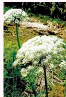
スヌーピーの耳(60歳)

投稿・問合せ先/本庁秘書広報課企画総務・広聴広報G(内線4122) ✉koho@city.satsumasendai.lg.jp