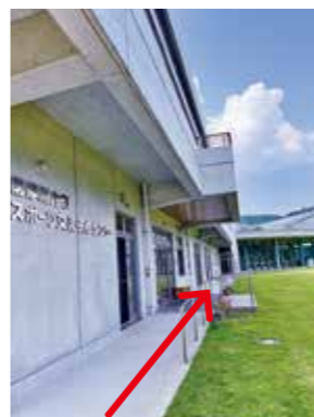
▲矢印の方へ進むと、サンアリーナさんだいへ行くことができます。

バレーボールのコートを最大で6面立てることができ、ジムも設備が充実しており、外ではランニングや坂道ダッシュもできる。最も良いと感じる点は、体育館と宿泊所が近いところ。特にバレーボール女子日本代表チームは、個人練習の時間が長い。ホテルだと全員がそろってから移動しなければならぬが、薩摩川内市の施設は、すぐ近くにあるので、団体行動や移動時間を気にせず、個人で自由に練習できるところが素晴らしい。必要とするものがコンパクトにあるので、とても利用しやすい。