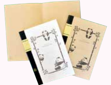
▲竹紙100ノート

※うぶごえとおくやみは、本庁市民課または各支所、甌島振興局などに届け出(出生・死亡)をされた方で、広報紙への掲載に同意された方のみを掲載しています。