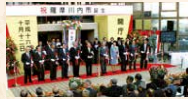
▲開庁式の様子

このコーナーでは、今年の10月12日に薩摩川内市が誕生して20年の節目の年を迎えることから、広報薩摩川内などに掲載された写真により、本市のこれまでの振り返ります。