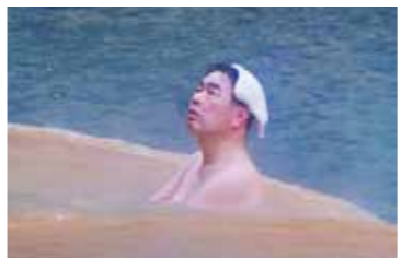
鹿兒島温泉観光課 六三四城ホームページ

しい情報を知らない人が多いという。自身も幼い頃に温泉で走り湯船で泳いで、客に叱られたことが、正しい温泉の入りを伝える「浴育」の原点となったそうです。「高城温泉が無ければ今の自分は存在していないと言ってしまうのではない」と言います。 温泉力+αの力 温泉を残していくためには、歴史、自然、文化、食など、その温泉地域ならではの「独自性」を生み出していくことが重要になるそうです。また、「さまざまなデータから見ると、昔のような活気ある温泉街に戻る可能性はわずかで、『温泉力+α』が鍵となってくる」と言います。 どのように温泉地周辺の町づくりをしていくか、どのように温泉の魅力若者へ発信していくか、将来の「温泉」を考える六三四さんは、これからも未湯の地を探し求めます。