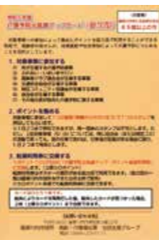
▲参加型(だいたい色)