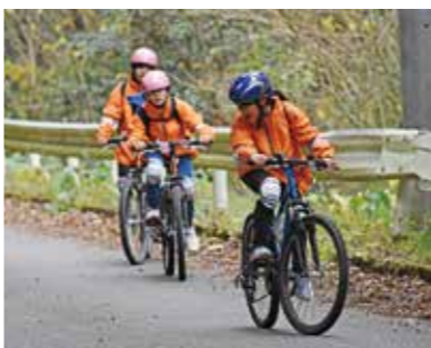
▲冬のアドベンチャー「薩摩川内ぼっけもん」の挑戦で82キロメートル完走に向けて自転車走行

研修を目的とする5人以上の団体（保育園（保育所・認定こども園・地域型保育事業）、幼稚園、学校、PTA、スポーツ少年団、子ども会、部活動、家族、グループ、企業など）であれば、誰でも利用することができます。 ※営利目的は不可