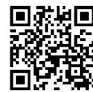
▲少年自然の家 地図