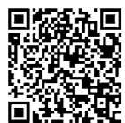
▲少年自然の家 ホームページ

1泊2日という限られた時間の中、生徒たちと非日常の体験をさせていただき、とても充実した2日間を過ごすことができました。 【元気はつらつスクールに参加 60代】 知人の声掛けで参加しましたが、講話を聞いたり、ピザ作りをしたりと、とても楽しい時間を過ごしました。また、和気あいあいとたわいのない会話を他の参加者とできたこともうれしかったです。