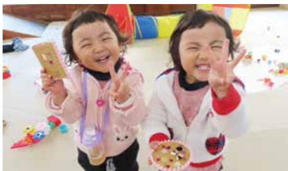
▲オタムフェスタでオリジナルコースターを制作し、大満足の笑みを見せる子どもたち

「てらやまんち」は、人との交流の場、家族のふれあいの場、生きがいづくりの場、豊かな自然を感じて感動する場、子どもたちが困難に挑み、自信を深める場です。一言でいうと「笑顔」になれる場所です。 「てらやまんち」でさまざまな体験をしてみませんか。