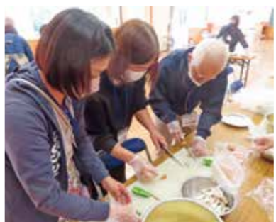
▲元気はつらつスクールでピザ作りに挑戦