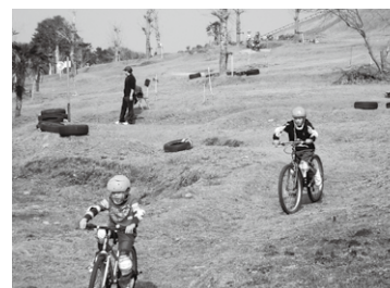
自転車モトクロス場