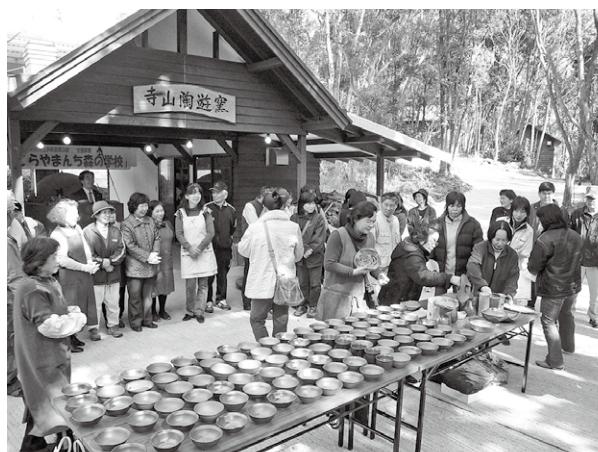
寺山陶遊窯(穴窯)で焼いた作品