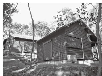
野外宿泊施設(バンガロー)

● 問合せ＝少年自然の家 TEL 0996 (29) 2114 FAX 0996 (29) 2115