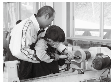
ふれあい工房での「木の器」作り

本館(集会室、視聴覚室、研修和室、工作室、プラネタリウム室など) 宿泊棟(定員248人)、プレイホール(バレーボールコート1面)、キャンプ場(6人用テント38張り)、野外宿泊施設(3棟)、森の遊学館、ふれあい工房(木工旋盤、電動ろくろなど)、寺山陶遊窯(穴窯、電気窯)、ふれあい炭焼窯、野外活動施設(自転車モトクロス場、冒険の森など)