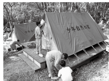
キャンプテントサイト