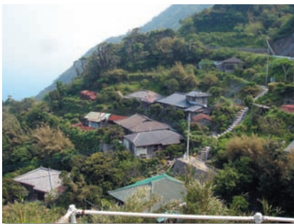
隣へ行くにもこの階段。平地の少ない内川内の生活道路です。