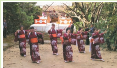
三味線と太鼓にのせた華やかな舞。