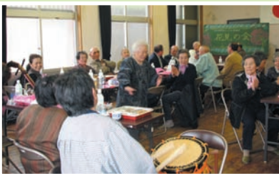
マワイ踊りに盛り上がる花見の会。

春になると、自分たちで手入れした桜並木や山々を飾る色とりどりの山桜を眺めながらの花見の会、秋には住民のほとんどが参加する敬老会が開催されます。ここではタオルをバトン代わりに回し、一人ずつ踊る恒例の「マワイ踊り」が行われ、ベテランの方々の手踊りが披露されます。このように、人は少なくても、いつまでも明るく元氣な人が集う内川内であり続けたいものです。