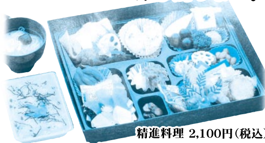
精進料理 2,100円(税込) 数に限りがございますのでご予約はお早めに。

お盆料理のご予定はお決まりでしょうか? すべての材料に真心をこめた精進料理を... ご予約承り中!!