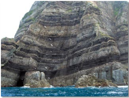
むき出しの地層が美しい「鹿島断崖」。ウミネコの繁殖地としても有名です。

さて皆さん、漁村留学制度「ウミネコ留学」をご存知ですか。鹿島地域でも子どもたちの数が減少しているため、甑島地域以外(遠くは東京都、埼玉・宮城県など)から小・中学生を募集し、鹿島地域の里親の元で1年居住しながら学校へ通学する制度です。また、家族全員での家族留学制度もあり「1年間では足りない」と3〜4年留学している子どももいます。