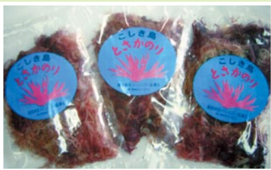
酢の物や海藻サラダにもってこいです。

■問合先 鹿島地区コミュニティ協議会 ■所在地 〒896-1301 鹿島町蘭牟田 1530-1 ☎・FAX 09969(4)2215