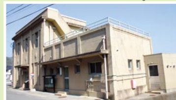
登録有形文化財「住民生活センター」

鹿島は祭りが盛んで、5月はウミネコまつり、7月は鹿の子百合まつり、8月は港まつりと町中総出でにぎやかになります。港まつりのころは島外からの観光客もピークを迎えます。観光客の素敵な思い出になるよう、地区コミュニティ協議会一同、これからも汗をかいて頑張っていきます。