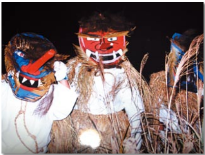
年に1度だけ、大みそかの日に山から降りて見回りをする神様「トシドン」

す。交通死亡事故ゼロの連続記録が日本一の安全・安心なまちで、都会では体験できない網持ちや磯遊び、世話好きなたまごの方々の交流を楽しんでいます。 鹿島地域には、ずっと昔のそのまた昔から毎年大みそかの夜に、「トシドン」が決まって鈴を鳴らしながら山から降りてきて、1年間の行いを反省させるために子どもたちの家々を回る風習があります。 この日は、子どもたちはとても良い子になってお手伝いをすんでします。でも、トシドンはお見通し。その日はいい子でも、1年間の良い行い・悪い行いを知っているからさあ大変。痛いところを突かれた子どもたちは、ますますトシドンを怖がります。ときには泣き出す子どもも。最後に子どもに「良い子になります」と約束させ、大きな餅などを渡して帰ります。 鹿島ではこのトシドンで1年を締めくくり、そして新年を迎えるのです。