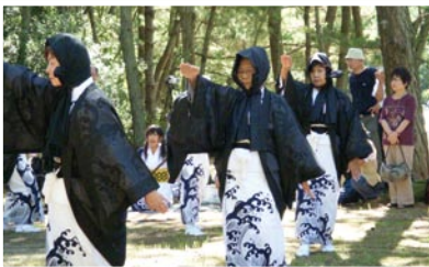
保存会員による想夫恋の踊りです。

久見崎盆踊り「想夫恋」は、今から400年前の慶長の役の際、軍港であった久見崎の港から高麗へ出陣。翌年、秀吉の死を機に終戦となり兵を引き揚げましたが、この戦いで多くの犠牲者が出ました。島津家久の代に、敵・味方、双方の霊を慰めるため、旧7月14日現在の8月16日に地元に残る、夫などを亡くした女性たちが踊ったものが想夫恋の基になったといわれています。そのいでたちは、高祖ぎきんで「おもて(顔)を包み、男物の紋付き羽織、背中には脇差しを差した特異な装束で、物静かな踊りです。昭和46年に県無形民俗文化財に指定され平成13年には韓国で舞台発表も行いました。また伝承行事として、五穀豊穡・子孫繁栄を願う「次郎次郎踊り」があります。毎年3月の第一日曜日に奉納され、「テチヨ・次郎・力カア」の配役があり、持ち回りで踊り、その内容も途中でアドリブが入るなど面白おかしく繰り広げられます。そして最後に踊り手が紅白もちやお菓子をまいて終了します。