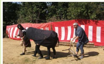
伝承行事の次郎次郎踊りです。

■問合先 滄浪地区コミュニティ協議会 ■所在地 〒895-0132 久見崎町 191 - 1 ☎・FAX 0996(27)3159