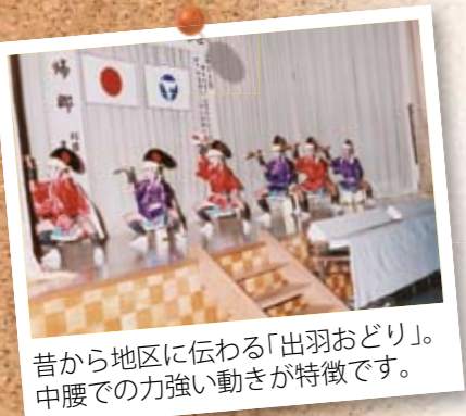
昔から地区に伝わる「出羽おどり」。中腰での力強い動きが特徴です。

イベント・郷土芸能 三大イベントとして、花火大会や盆の帰省客も加わり盛大に行われる「夏まつり(8月)」、長浜小との合同運動会(9月)、敷塩神社の祭典で船団パレードや中学生相撲大会が行われる「長浜港まつり(11月)」を開催し、毎年にごわっています。 代表的な郷土芸能は「出羽踊り」です。これは昔から伝わる盆踊りの代表的なものです。12～13歳の男子が踊り子となり、6～12歳の偶数で編成され、全員が烏帽子、手甲、脚半を着け、奴風の短い衣に角帯を締め、濃紺の前垂れを掛け、手に日の丸の扇子を持ち白足袋姿で踊ります。毎年合同運動会、文化祭などで披露しています。 波濤太鼓は昭和59年、地域おこしの一環として、「新たな郷土芸能」と青年層を主に発足したもので、冬の荒れ狂う海の壮絶さと、どこまでも青く澄んだ穏やかな海をイメージして作られた勇壮な太鼓と歌、踊りとなっています。