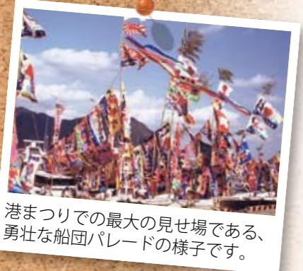
港まつりでの最大の見せ場である、勇壮な船団パレードの様子です。