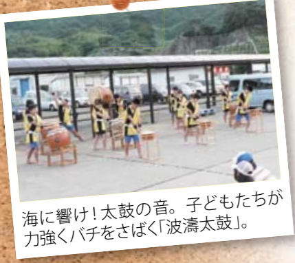
海に響け!太鼓の音。子どもたちが力強くバチをさばく「波濤太鼓」。