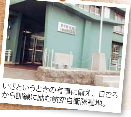
いざというときの有事に備え、日ごろから訓練に励む航空自衛隊基地。