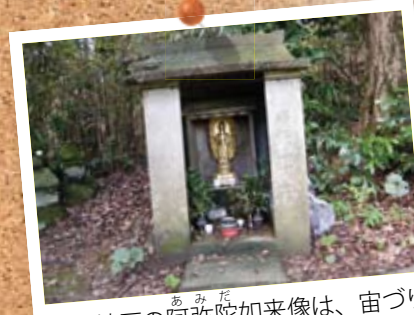
西方地区の阿弥陀如来像は、宙づりになっているのが特徴です。