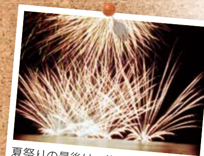
夏祭りの最後は、海中・海空花火です。ほかでは見られない花火ですよ。