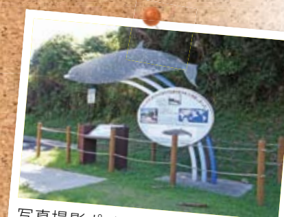
写真撮影ポイント「とるぱ」。希少な鯨が漂着した記念の看板もあります。