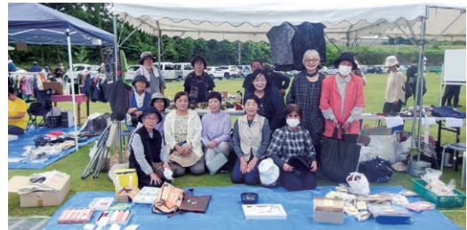
【情報提供：隈之城地区コミュニティ協議会】

5月14日(日)、隈之城地区コミュニティ協議会の女性部会が「大原野池公園ちよこっとフリマ」を開催しました。部会員や地域の皆さんが出店し、大いににぎわいました。今後もSDGs「つくる責任つかう責任」をテーマに、年に数回開催し、収益の一部を地域貢献などに役立てたいと考えています。