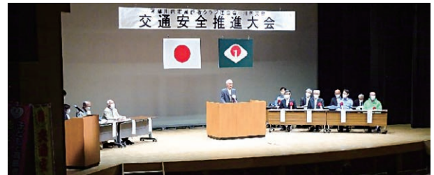
【情報提供：薩摩川内市高齢者クラブ連合会川内支部】

5月11日(木)、国際交流センターで本市高齢者クラブ連合会川内支部が交通安全推進大会を開催しました。会員140人が参加し、交通安全の講話後、大会宣言を全員で唱和しました。安全運転に心掛ける、子どもたちの安全を守るなど5項目の交通事故安全対策の推進を宣言しました。