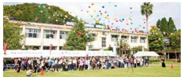
【情報提供:上手地区コミュニティ協議会】

上手小学校の閉校記念イベント「風船飛ばし」では、地域の方々も多く参加し、色とりどりの風船が、感謝や希望、それぞれの思いを乗せて、青い空に飛んで行きました。