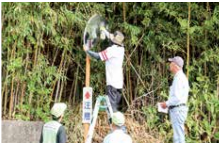
【情報提供:水引地区コミュニティ協議会】

毎年9月に行っている恒例行事で、地区住民や道路使用者の安全を願い、ミラーの曇りや汚れを拭き取りピカピカにしました。