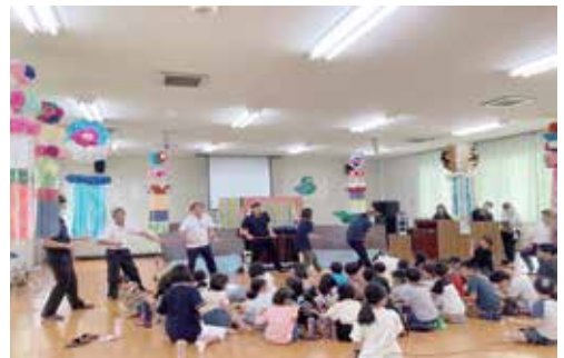
【情報提供: 育英地区コミュニティ協議会】

8月30日(水)、育英地区コミュニティセンターで、「ハッピー七夕会」を開催しました。これは、育英地区、隈之城地区、鳥丸地区、藤川地区の4地区コミュニティ協議会が合同で行ったもので、子どもから大人まで約50人が参加し、七夕のお話や人形劇、寸劇などを楽しみました。