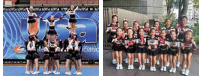
【情報提供: Satsuma Allstar Cheer】

本市で活動するSatsuma Allstar Cheerが小学生以下の部門に出場し、初優勝を果たしました。14人の子どもたちは心を一つに笑顔で演技を披露しました。