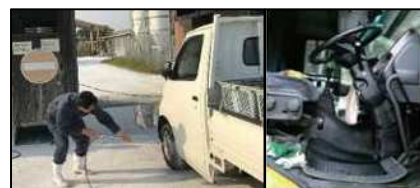
車両はタイヤだけでなく、 泥よけの内側まで消毒 し、 フロアマットの交換やペダル等車内も消毒