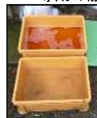
推奨される踏込消毒槽の設置方法