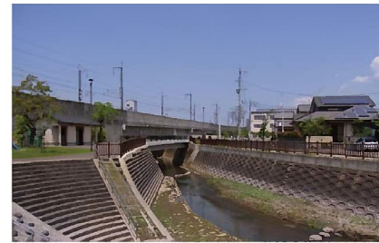
⑦ 親水公園・春田川