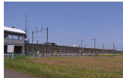
③ 敷地西側新幹線高架