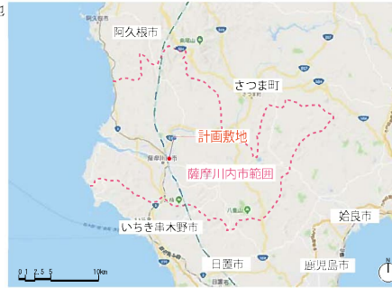
薩摩川内市周辺図