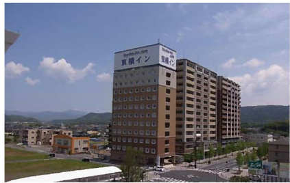
⑤ 敷地東側向かいのホテル・マンション