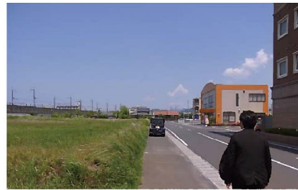
⑥ 敷地東側前面道路