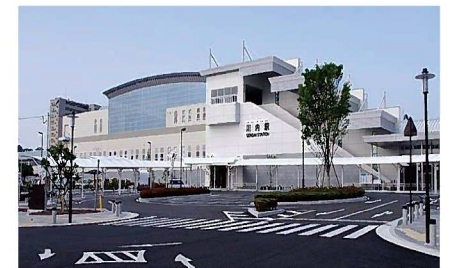
④ 川内駅東口ロータリー