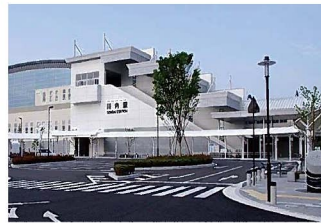
川内駅東口ロータリー

川内駅は、JR九州新幹線・JR鹿児島本線・肥薩おれんじ鉄道線の3路線が乗り入れる接続駅であり、市の主要な交通網の一つとなっている。九州新幹線の全線開業に伴い、博多駅から約1時間、熊本駅から約30分、鹿児島中央駅から約10分のアクセスであり、本市へのアクセス利便性は高い。また、甌島国定公園をはじめ、北薩地域及び霧島錦江湾国立公園等の観光資源への玄関口であり、鹿児島県北部観光の誘導拠点としても期待される。