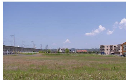
② 駅前ロータリーから敷地全体を見る