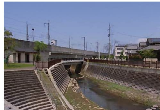
親水公園と春田川

敷地北側隣地には、街区公園である親水公園が隣接する。親水公園には、春田川が流れ親水空間が形成されており、市民の憩いの場となっている。