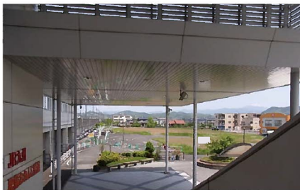
① 駅東口から敷地全体を見る