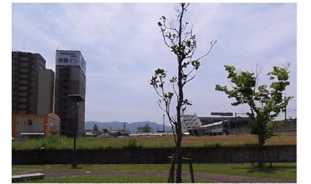
⑧ 親水公園から敷地を見る