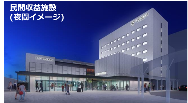
民間収益施設 （夜間イメージ）