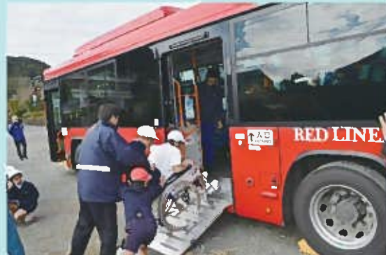
車いす利用者に乗せているところ