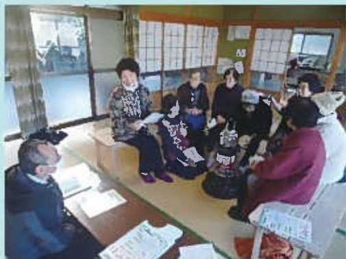
那答院地域内のサロンを利用した出前講座の様子