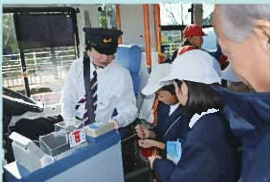
両替機を使った運賃支払いを体験中