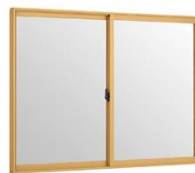
客室等のサッシ修繕