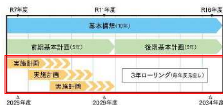
<総合計画期間イメージ>