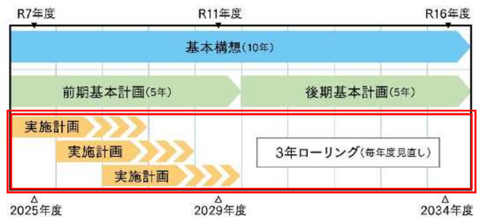
<総合計画期間イメージ>