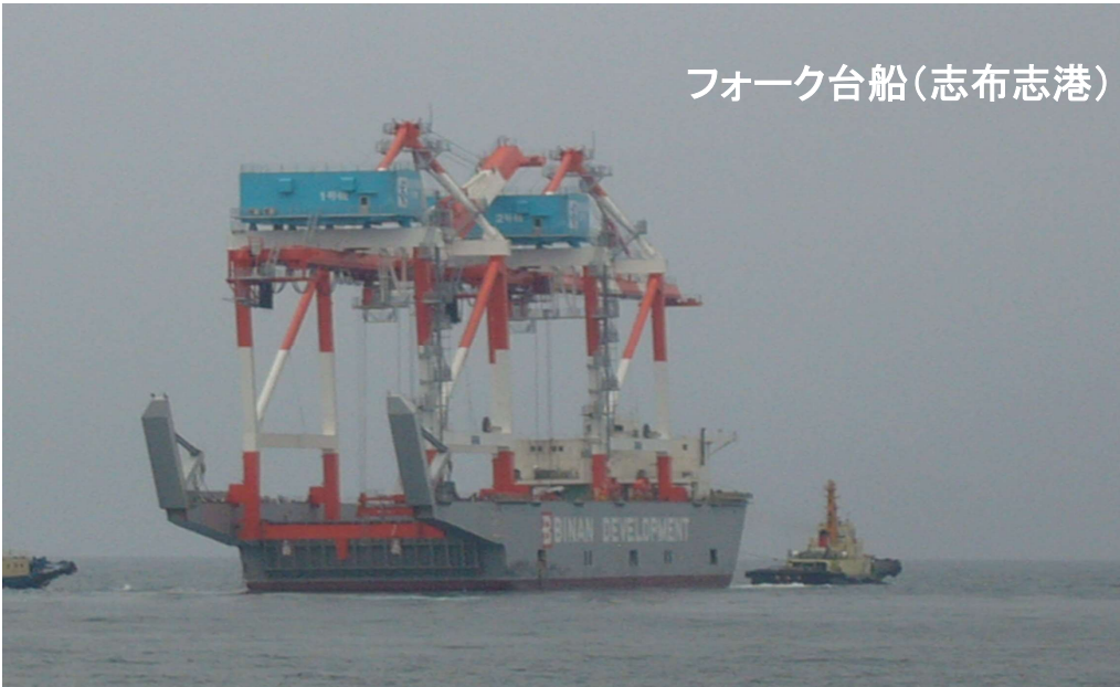
フォーク台船(志布志港)