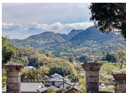
入来麓を見守る西郷さん（寝西郷）