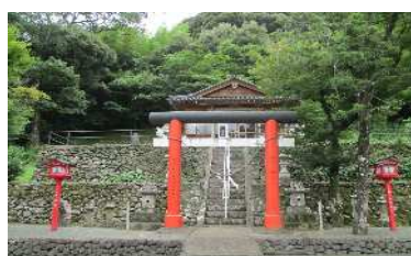
一條神社と歴史の杜