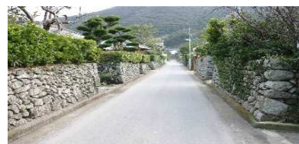
里町武家屋敷跡の玉石垣