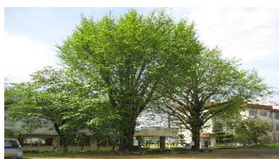
南瀬のイチョウの木