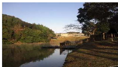
憩いと歴史の中郷池