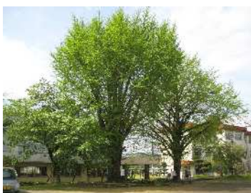
南瀬の夫婦イチョウ（雄株・雌株）