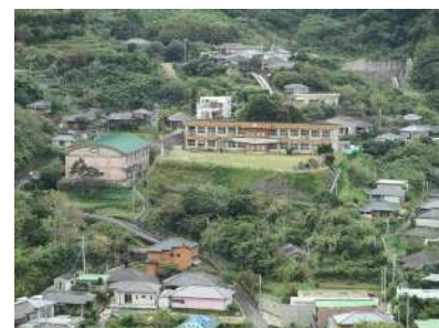
旧西山小学校と瀬々野浦集落 ～先人から受け継ぎ育んできた 校庭の石垣～