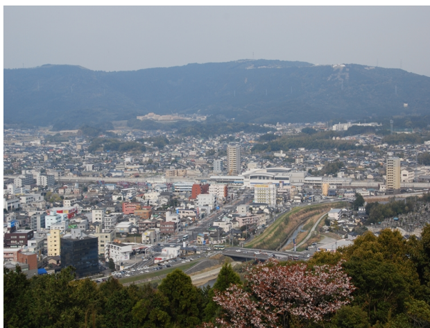
清水ヶ岡から見る市街地