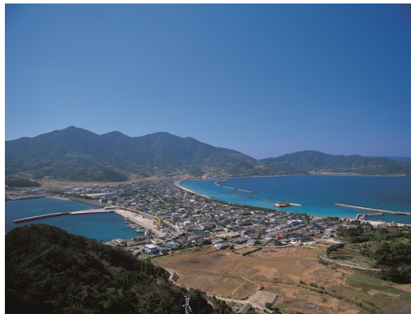
トンボロ地形（陸繋砂州）