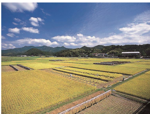
高江町の水田地帯