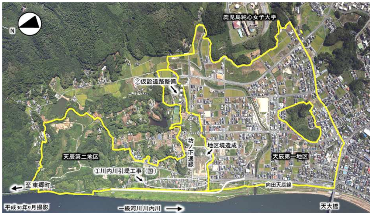
① 川内川引堤工事(国)

国土交通省施工による川内川引堤工事に併せて、本市では建物等移転補償や道路築造・造成工事等を進めているところです。また、坊ノ下通線の築造や地区境周辺の造成等の工事を行っており、令和4年度も引き続き実施しております。地域の皆様方には、工事の影響で迂回路を通行していただき、また騒音やほこり等で大変ご不便、ご迷惑をおかけしておりますが、ご理解とご協力をよろしくお願いいたします。